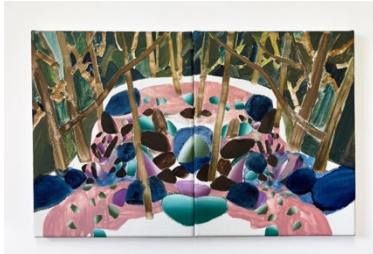
Una Ursprung, 우나 우스푸룽 Subtle changes in the stones, 2024 40 x 60 cm, 캔버스에 오일