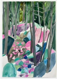
Una Ursprung, 우나 우스푸룽 Gemstone forest-2, 2024 42 x 29.7cm 종이 위에 수채와 풀라쥬 (300g/m2)