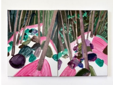
Una Ursprung, 우나 우스푸룽 Lost in the same day, 2024 40 x 60 cm, 캔버스에 오일