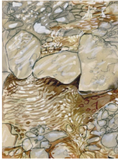
Jean Dubuffet Torrent , 1953 32 x 34cm, frame: 56 x 46,5cm Gouache on paper