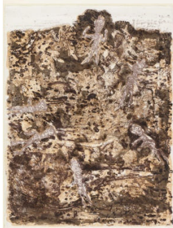
Jean Dubuffet Les défricheurs , 1953 65,5 x 50,1 cm, 리미티드 에디션 20, 넘버링, 싸인