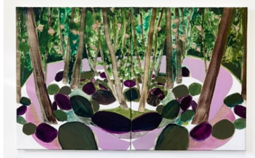
Una Ursprung, 우나 우스푸룽 Lost in the same day, 2024 50 x 80 cm, 캔버스에 오일