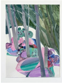
Una Ursprung, 우나 우스푸룽 Pink Life, 2024 42 x 29.7cm 종이 위에 수채와 풀라쥬 (300g/m2)