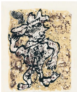
Jean Dubuffet, 장 뒤뷔페 Fougère au chapeau , 1953 65.7x50.5 cm 리미티드 에디션 60, 넘버링, 싸인 리토그래피