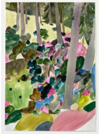
Una Ursprung, 우나 우스푸룽 Gemstone forest-3, 2024 42 x 29.7cm 종이 위에 수채와 풀라쥬 (300g/m2)