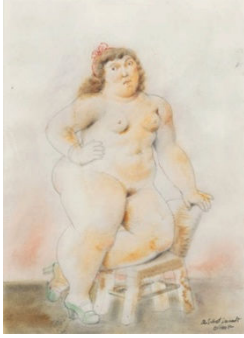
Fernando Botero Modèle à la chaise , 1992 46 x 35cm, frame: 70x57cm Pencil and watercolor on paper