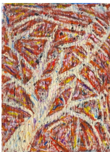
Hervé Bordas, 에르베 보르다스 Couchant, 2023 59 x 42.4 cm, 신문지 위에 혼합재료