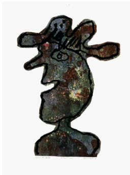
Jean Dubuffet, 장 뒤뷔페 Homme au chapeau , 1961 리미티드 에디션 50 + IV H.C, 넘버링, 싸인 60x47 cm 리토그래피