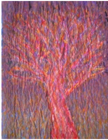
Hervé Bordas. 에르베 보르다스 Redshift, 2024 59 x 42.5 cm, 신문지 위에 혼합재료